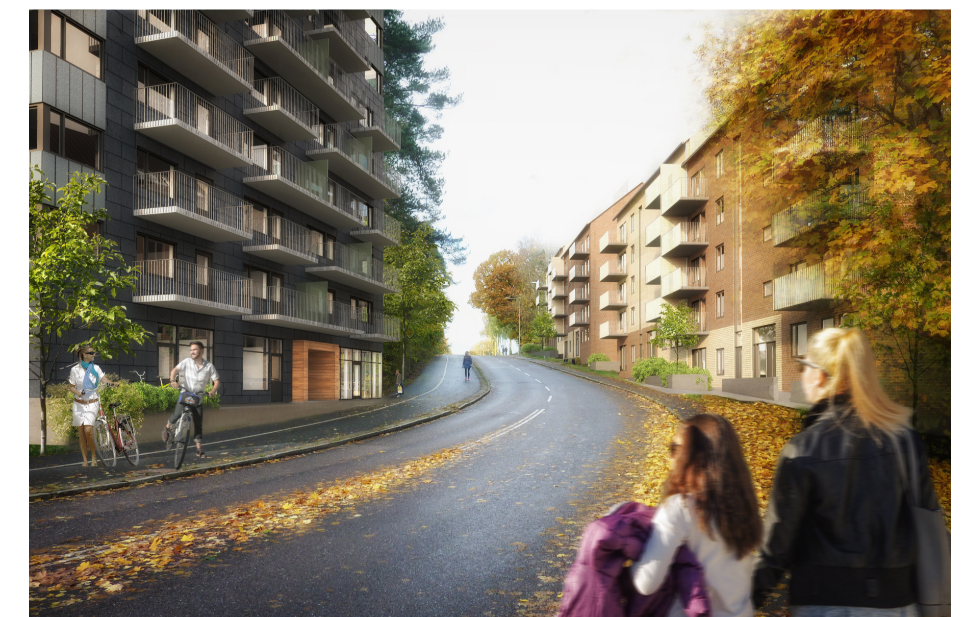
Fotomontage, Norconsult: Bebyggelsen längs Smörslottsgatan. Till vänster syns punkthusen. Till höger lamellhusbebyggelsen.