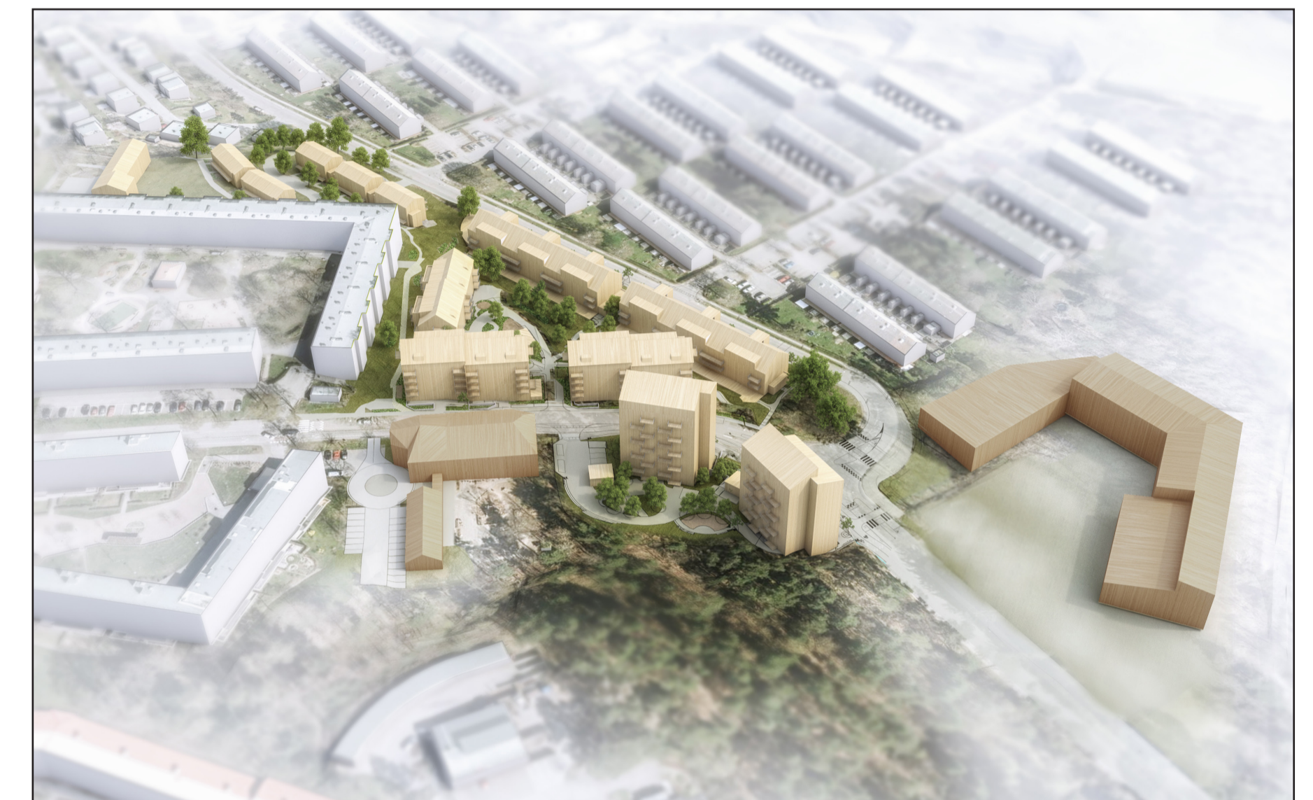
Volymillustration över planområdet, vy från nordväst, Norconsult.